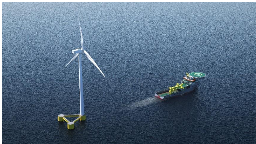
Artist's impression van een drijvende windturbine die wordt gesleept door een Boskalis AHT